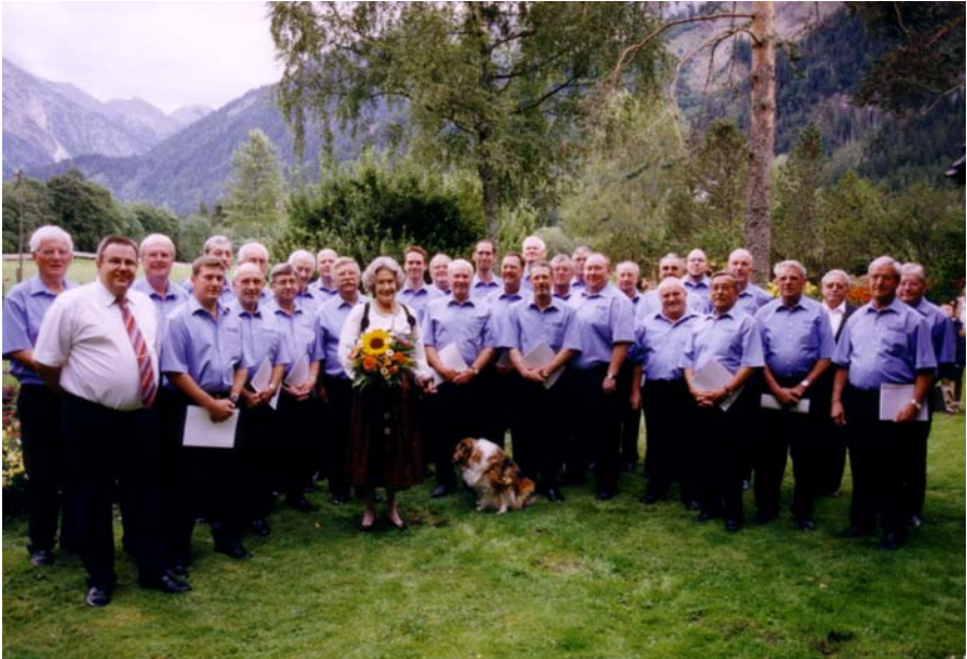
Der Chor in Hindelang 2004 mit Prinzessin Hella von Bayern