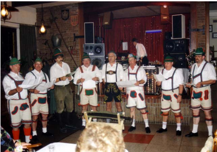
Unsere „Bayern“ beim bunten Abend in Scheidegg

Das Vereinsleben wurde gestärkt, als man am 06.10.1989 nach 10-jähriger Abstinenz eine 4-Tages-Fahrt nach Scheidegg im Allgäu organisierte. Dies war gleichzeitig, wenn auch etwas verspätet, ein Dankeschön des Vorstandes an die Sänger für die Erringung des Meistertitels und für die unermüdliche Hilfe der Sängerfrauen für die unzähligen Arbeiten der letzten Jahre.