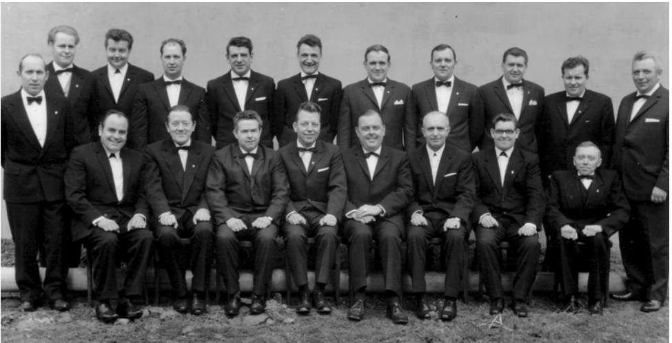
Der Chor im Jubiläumsjahr 1970

rinnen und Sänger von der Düsseldorfer Rheinoper, waren unvergessene Höhepunkte, die immer in Erinnerung der Mitwirkenden und Zuhörer verbleiben werden.